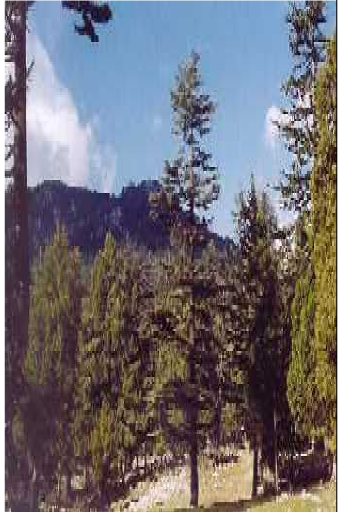
SIERRA TARAHUMARA EN CHIHUAHUA

El Consejo Civil ha venido haciendo gestiones en la CONANP para que se informe a la sociedad sobre dicho proyecto y para que se cumplan con las obligaciones que marca la ley ambiental para la creación de nuevas áreas protegidas. El Consejo Civil exigirá que antes de avanzar hacia un decreto, se tenga una justificación clara y contundente así como una aprobación de las comunidades locales.