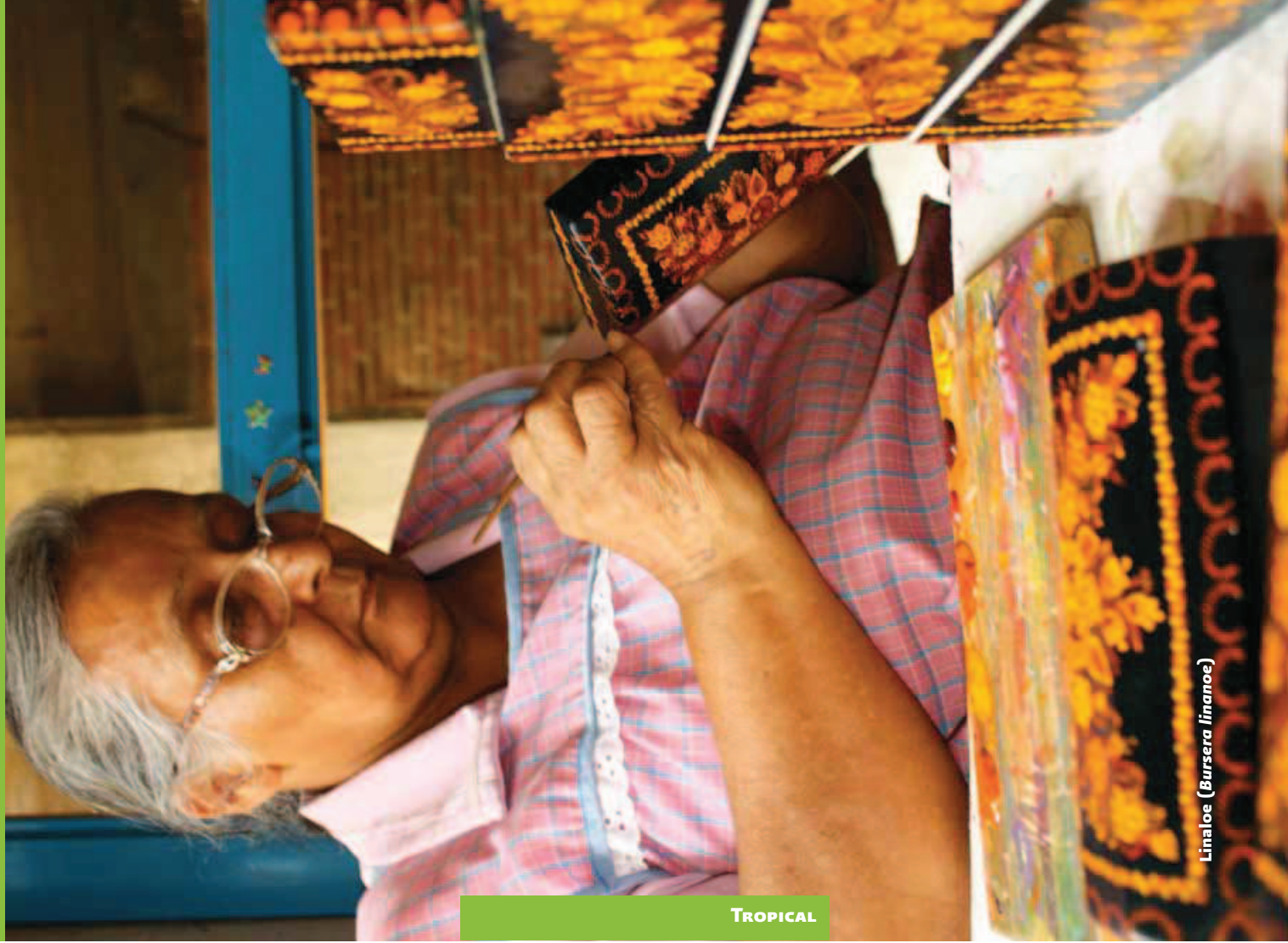
Linaloe ( Bursera linnaneae )