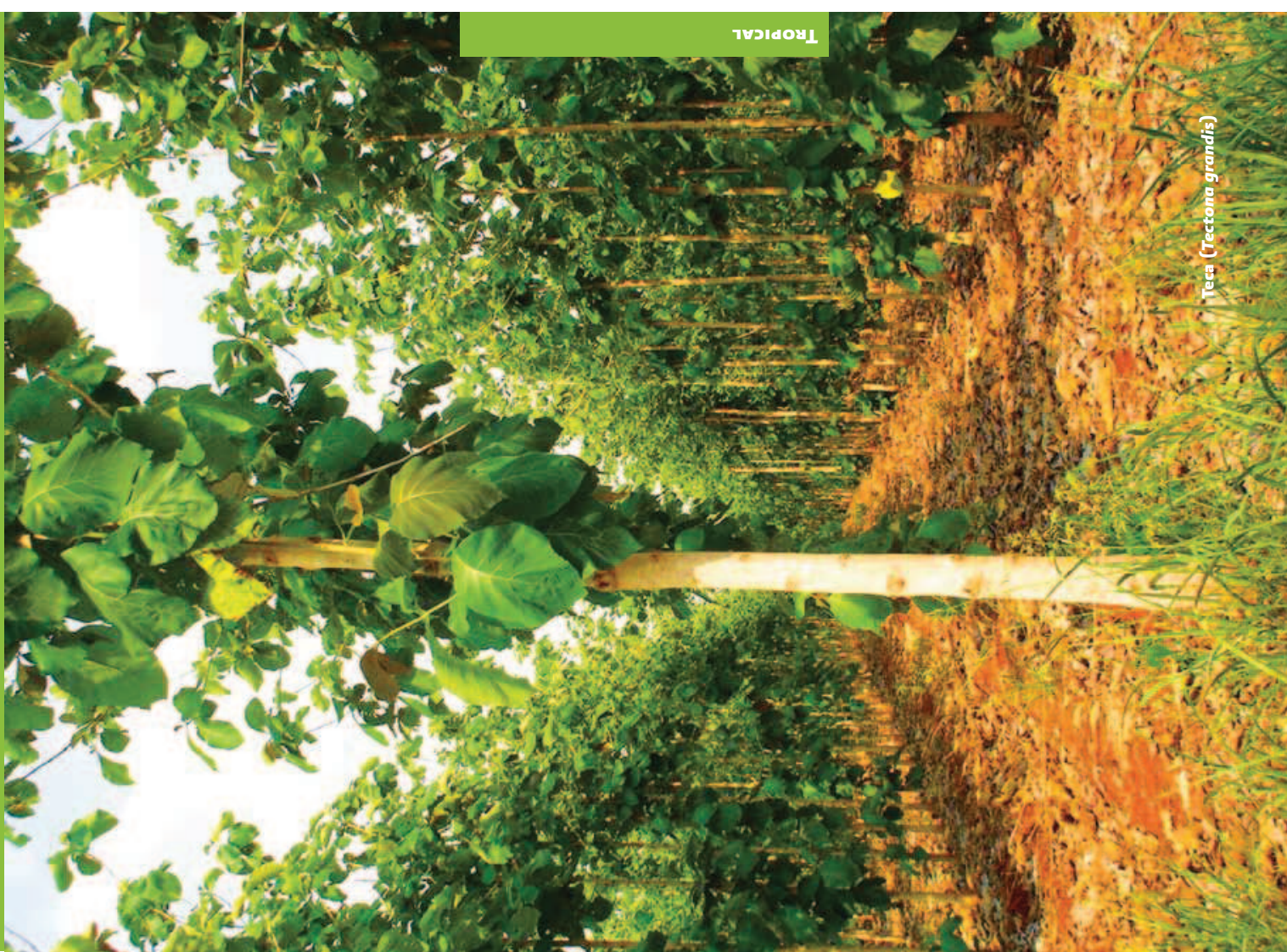
Teca ( Tectona grandis )

“El árbol del nim ( Azadirachta indica ) en el occidente de México: cultivo, usos como insecticida biológico y métodos de extracción” (Clave: 101172). El estudio tiene como objetivo generar el paquete tecnológico para el establecimiento de plantaciones de nim, con el fin de promover la extracción artesanal y semi-industrial de los ingredientes activos de la planta. También, evaluará dos extractos obtenidos para el combate de dos plagas primarias en maíz y así poder decidir la comercialización del producto de cualquiera de estos extractos.